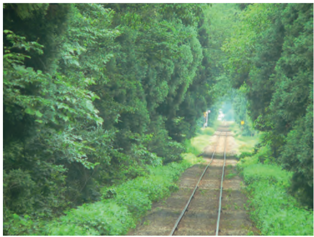
(上杉駅〜米内沢駅間)