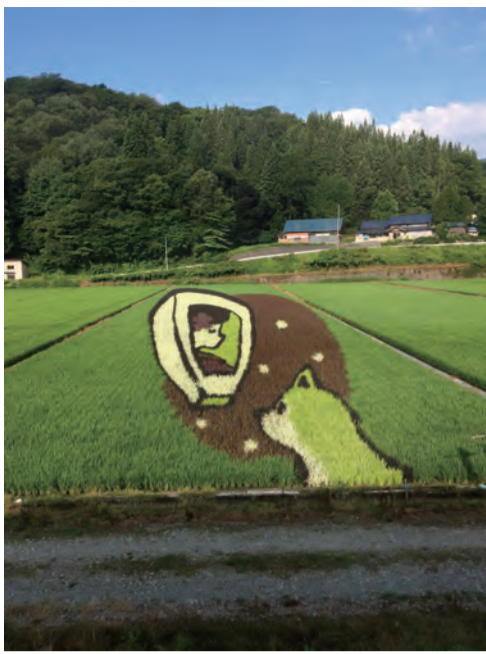
夏の風物詩「田んぼアート」(沿線5箇所)

内陸線の車窓から見える美しい景色「三大車窓」を決定する投票を実施しました。 応募総数251件、日本全国及び海外からの投票により、次の三つの車窓に決定しました。