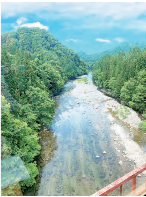
「大又川橋梁」から眺める阿仁川の渓谷美 (萱草駅〜笑内駅間)